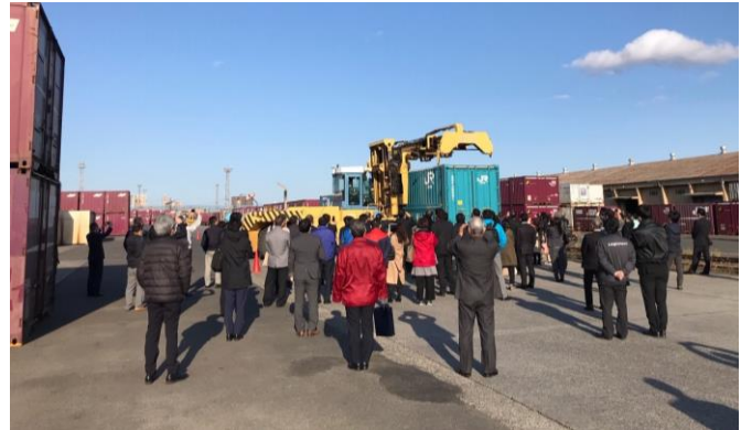
2021年度 鉄道コンテナ見学会の様子(仙台貨物ターミナル駅)