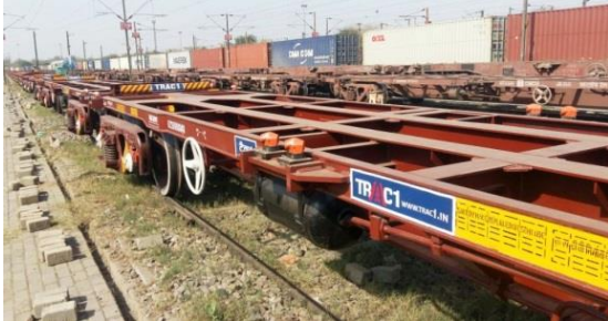
図1：CTO事業会社である JKTIのコンテナ用貨車