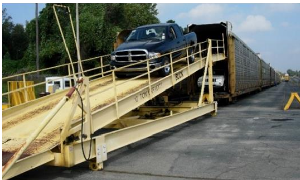
図4：海外の自動車専用輸送用貨車（参考）