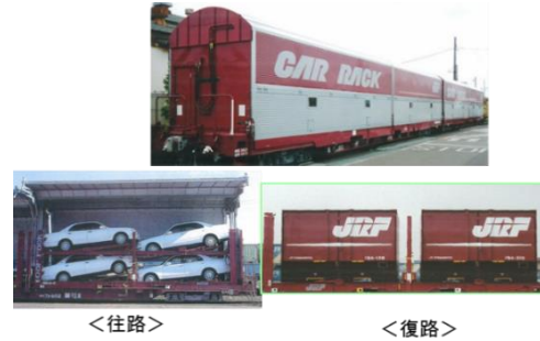
図2：日本の鉄道輸送技術