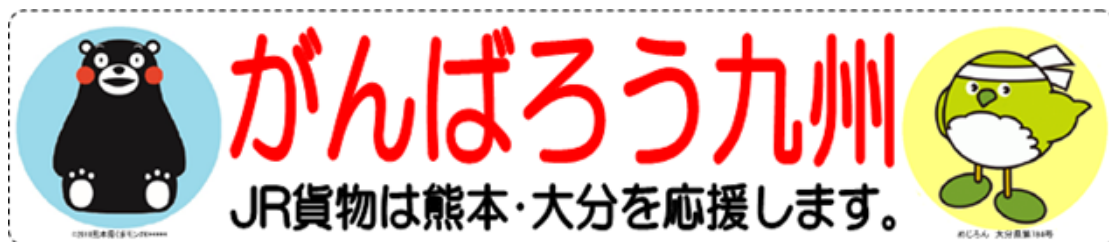
左:「くまモン (熊本県)」、右:「めじろん (大分県)」